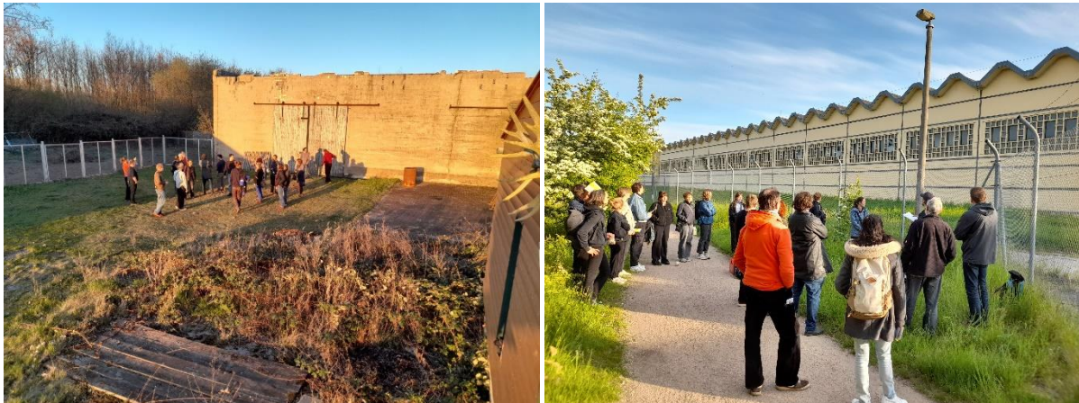
Abb. 1: Grundstück des entstehenden Vielseithofes in Pödelwitz (l.) und Blick auf einen Teil der Bestandsgebäude am Vorhaben Lebensmittelport Schönau (r.)